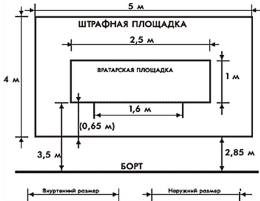
Рис. 2. Размер штрафной площадки во флорболе